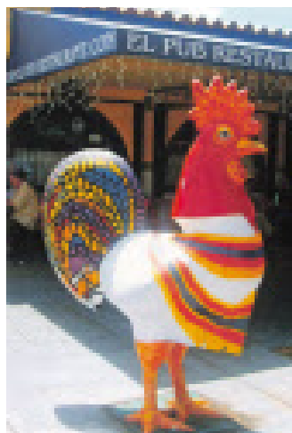
Little Havanna: Dies ist das Kubaner-Viertel in Miami.

Nach Fort Lauderdale fliegt als einzige Fluglinie aus Europa der Urlaubsflieger Condor (dienstags und freitags ab Frankfurt, www.condor.com ). Für luxuriöses Übernachten bietet sich das legendäre Hotel „Fontainebleau“ in Miami Beach an, das z. B. im Programm von Thomas Cook Reisen steht ( www.thomascook.at ). Mehr Infos über die Angebote von Thomas Cook Reisen und Condor erhalten